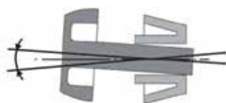
Guidage obturateur classique